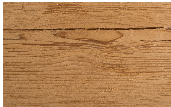
gehakt & gebürstet